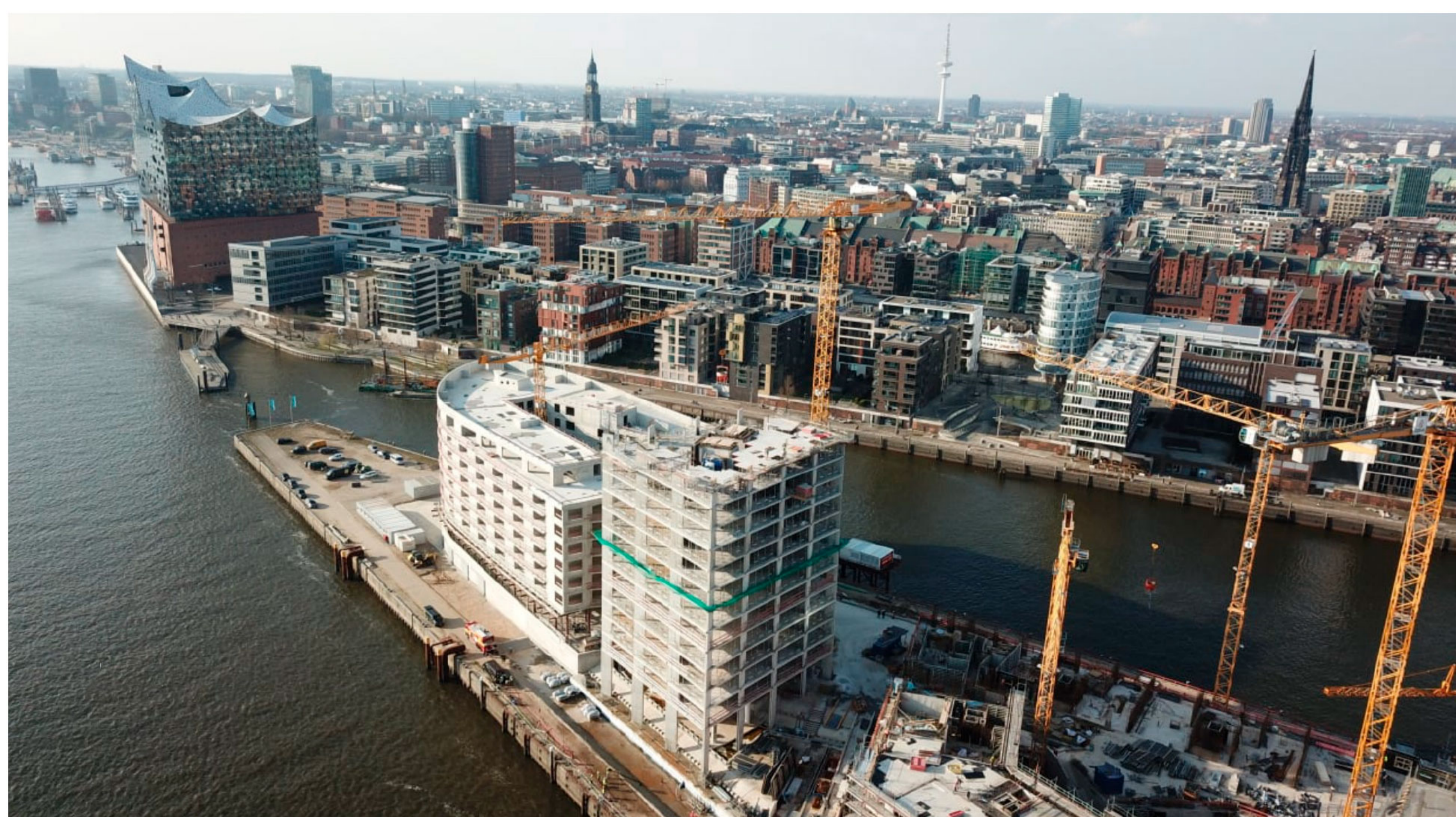
Strandkai aus Drohnen-Perspektive: 14 Etagen im „The Crown“ (Mitte) sind schon fertig

Die 75 Edel-Wohnungen (ab 53 qm, Durchschnittspreis 17 700 Euro/qm) mit Balkonen und Glasfronten lassen die Stadt-Silhouette zur Bühne werden, an dem sich die neuen Eigentümer nie satt sehen werden.